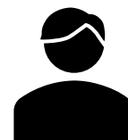
広告代理店様 (営業)

顧客へ提案する際、PRootから適正価格で印刷物を手配できるようになり、 仕入値が下がり粗利がUP + 相見積の勝率が上がり売上が拡大 した。