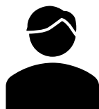
食品販売会社様 (経営者)

当初は発注先の切替に関して後ろ向きだったが、大幅なコスト削減に繋がったため 切替を意思決定 できた。